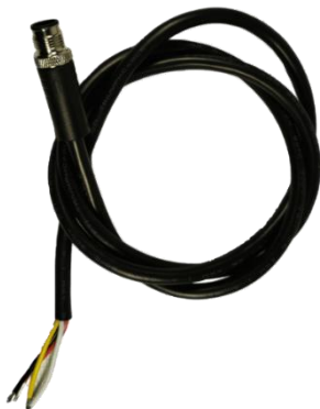
(M12-12): Кабель питания DC 4х полосный GPIO настраиваемый под ТЗ клиента