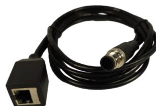
(M12-12): RJ-45 100M/1000M высокоскоростной, стандартный 8- контактный разъем локальной сети