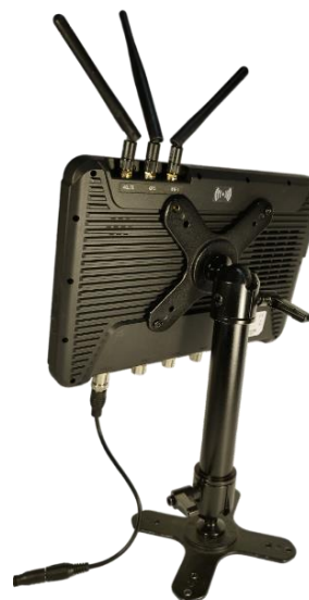
Крепление с шарнирами по стандарту VESA под ТЗ заказчика