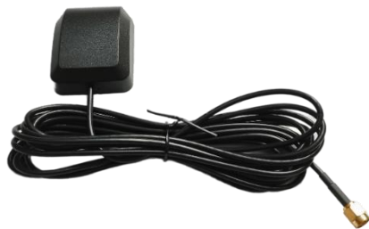
Внешняя активная антенна GNSS типа гриб