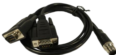
(M12-12): - RS232 x1+RS232/RS485 x1, - 9PIN DB9 полнофункциональный RS232; - 3PIN передача данных RS485/3PIN передача данных RS232