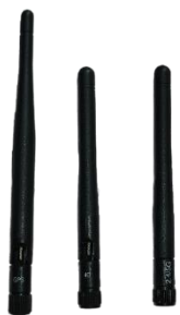
Внешние антенны 4G, GNSS, WiFi