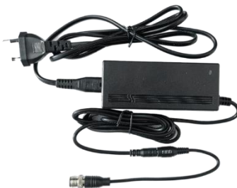
Блок питания, 19V/3.42A DC Ø5.5 с кабелем питания, 8 PIN разъем M12 в разъем Ø5.5мм