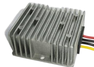
Преобразователь напряжения 9-36V DC/DC