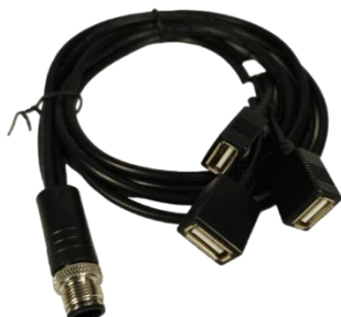
(M12-12): - USB 2.0 x2 + CAN/CVBS x1